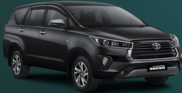
KENDARAAN JENIS SUV / MVP