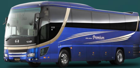
KENDARAAN JENIS BUS HIGH DECK