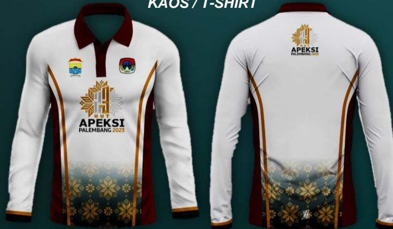
KAOS / T-SHIRT