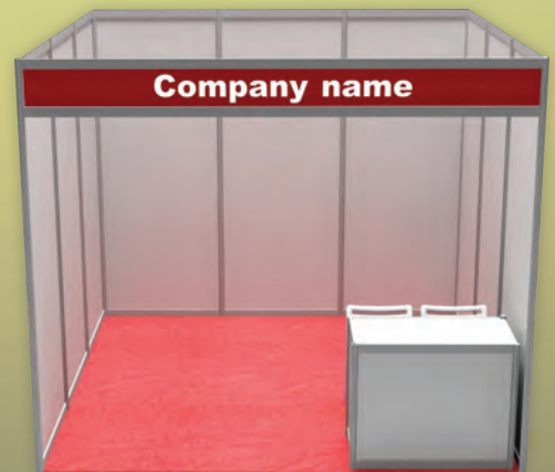
STAND 3 X3 METER