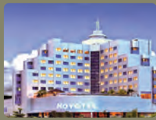
Novotel Balikpapan Jl. Brigjen Ery Suparjan No.2 Kota Balikpapan, Telp. (0542) 820820