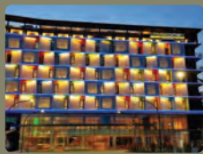
MaxOneHotels Jl.MT. Haryono No.02 Kota Balikpapan, Telp. 05428526888