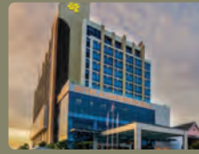
Platinum Hotel & Convention Hall Jl. Soekarno Hatta No.28, Kota Balikpapan, Telp. 05428830228