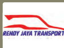
Rendy Jaya Transport Kalimantan Timur Telp. +62 813-4839-7112 Email :