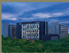
Four Points By Sheraton Balikpapan Jl. Pelita No.19,Balikpapan, Kalimantan Timur 76115 Telp. (0542) 8525888