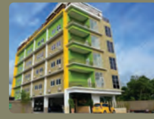
Best Inn Jl. MT.Haryono No. 77 Kota Balikpapan Kalimantan Timur Telp. (0542) 8510800