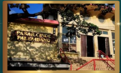
PASAR CINDE PALEMBANG