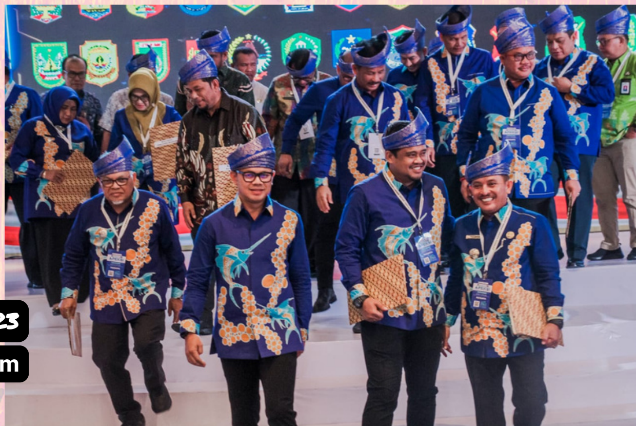
RAKERWIL I 2023