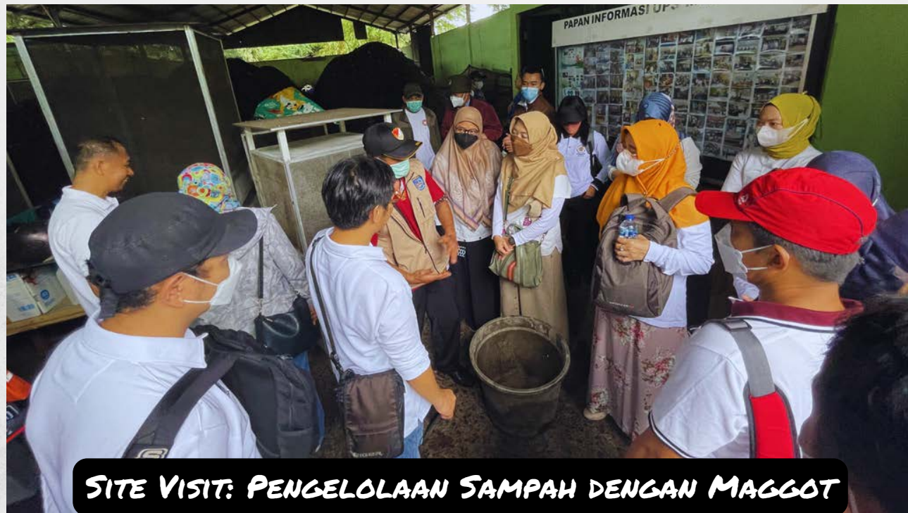
SITE VISIT: PENGELOLAAN SAMPAH DENGAN MAGGOT