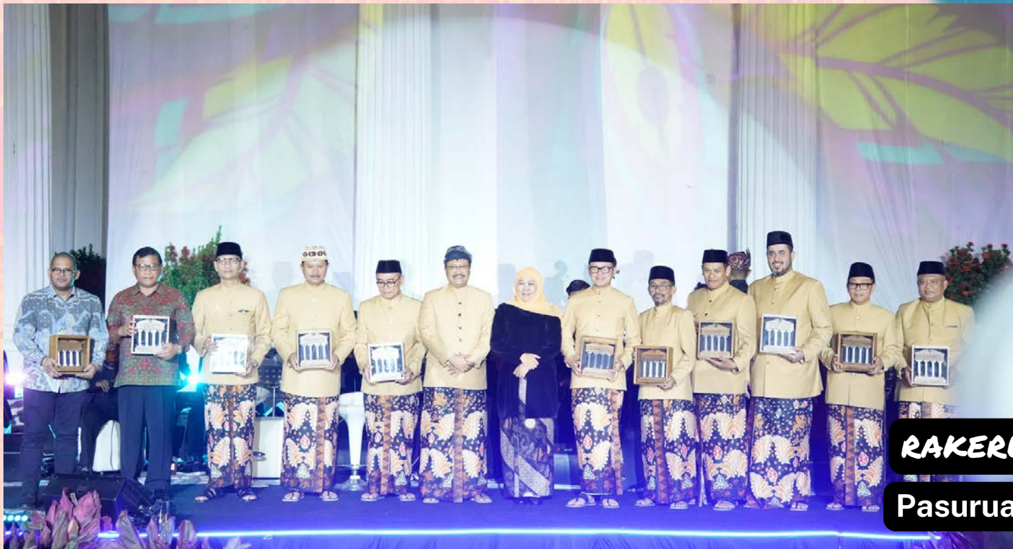
RAKERWIL IV 2023