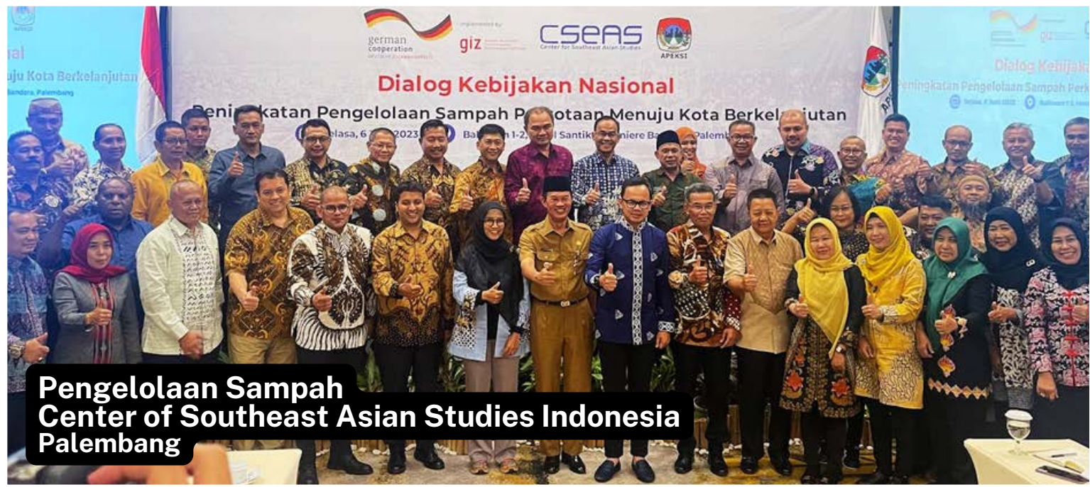
Pengelolaan Sampah Center of Southeast Asian Studies Indonesia Palembang