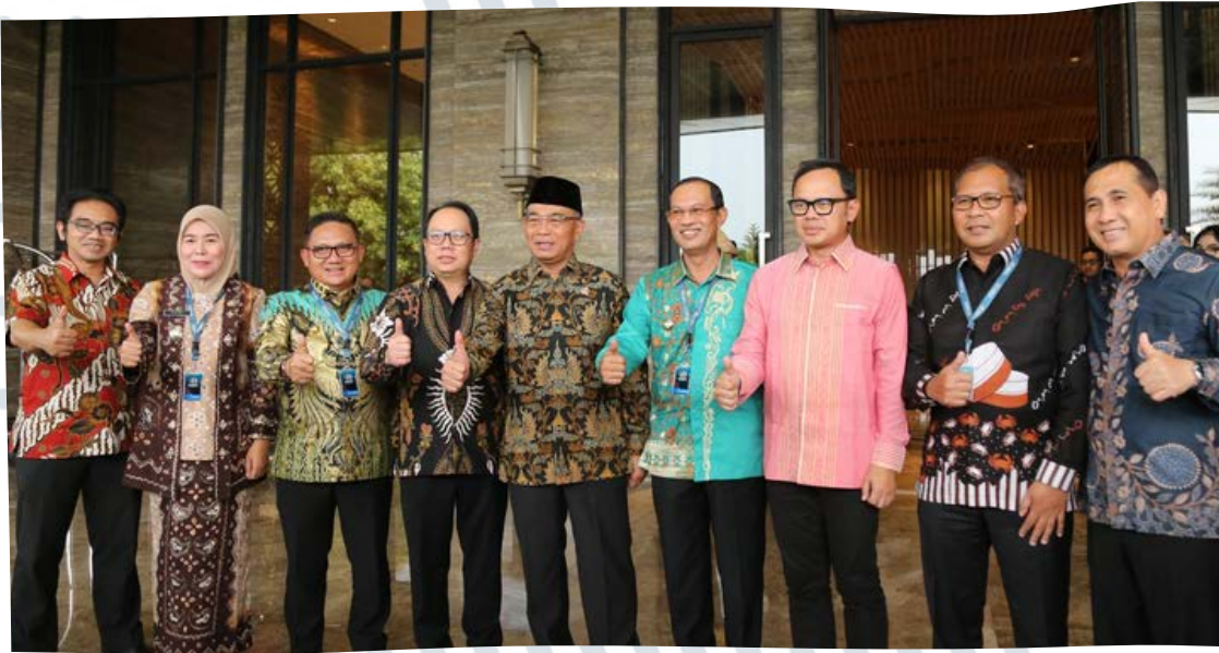
Bersama Menteri Koordinator Bidang Pembangunan Manusia dan Kebudayaan - Palembang