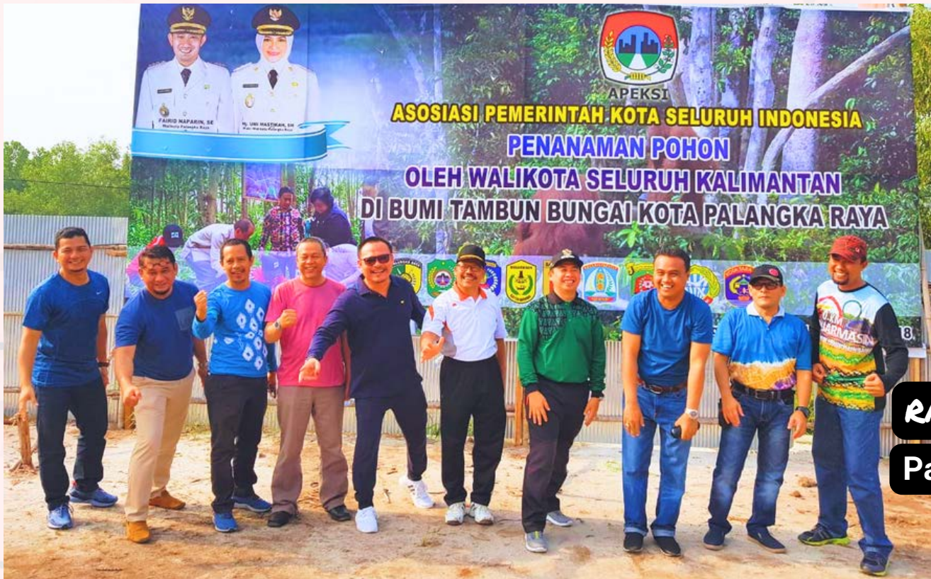
RAKORWIL V 2022