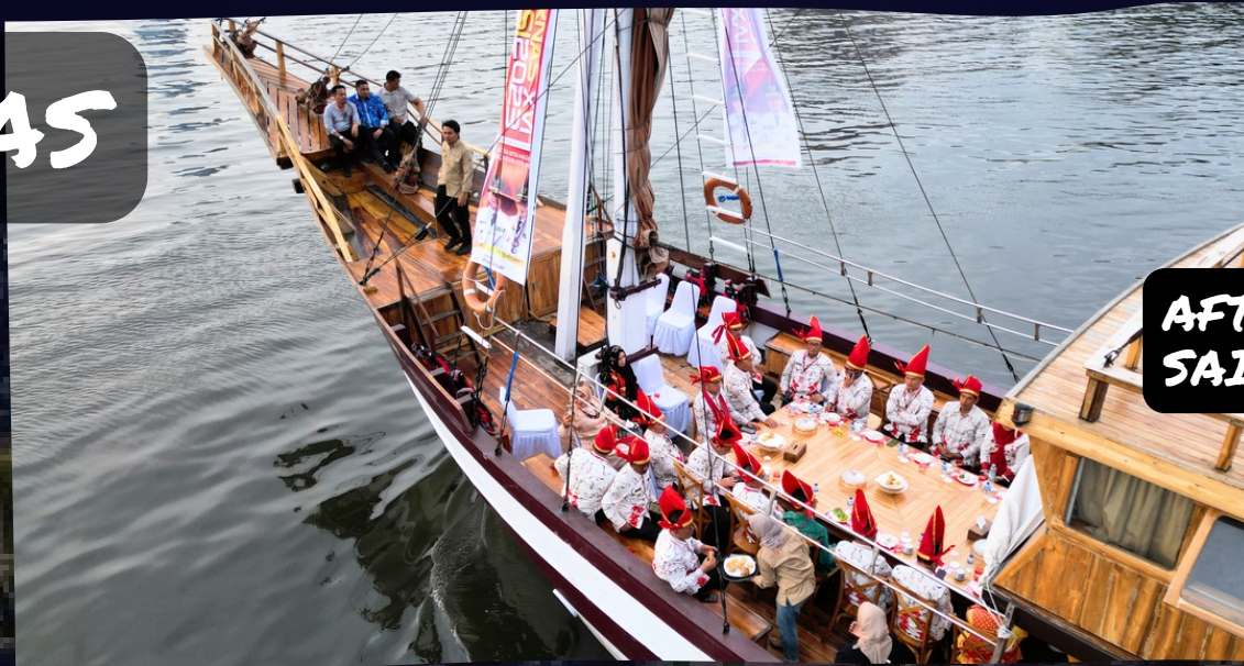
AFTERNOON TEA + SAIL PINISI