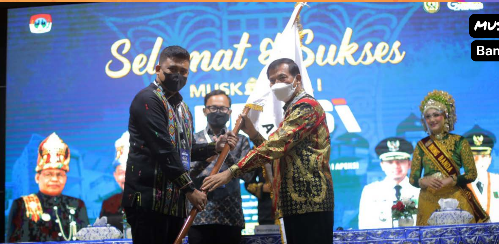
MUSKOMWIL I 2021