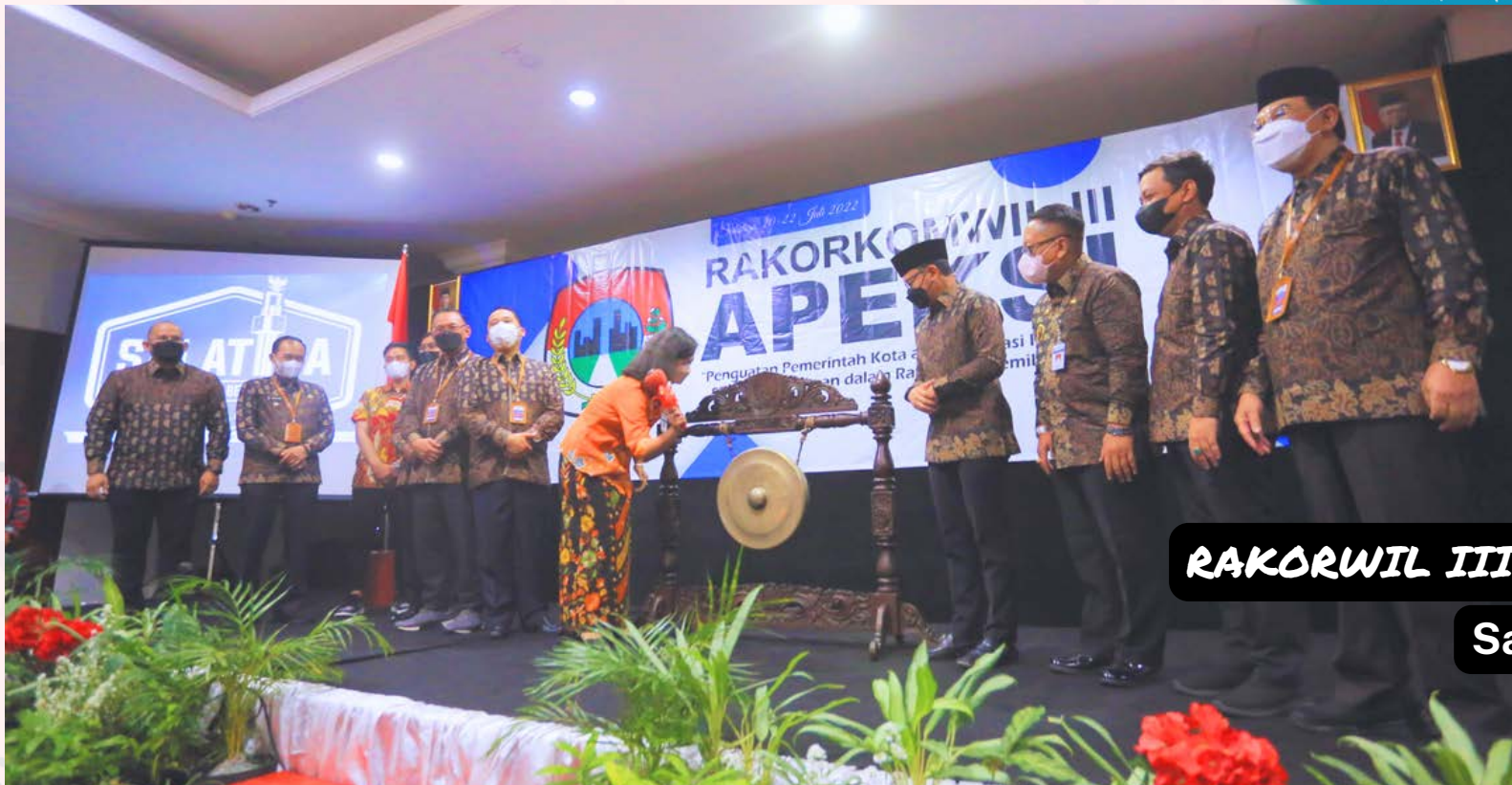
RAKORWIL III 2022