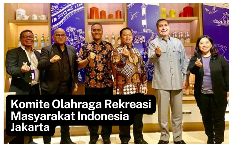
Komite Olahraga Rekreasi Masyarakat Indonesia Jakarta