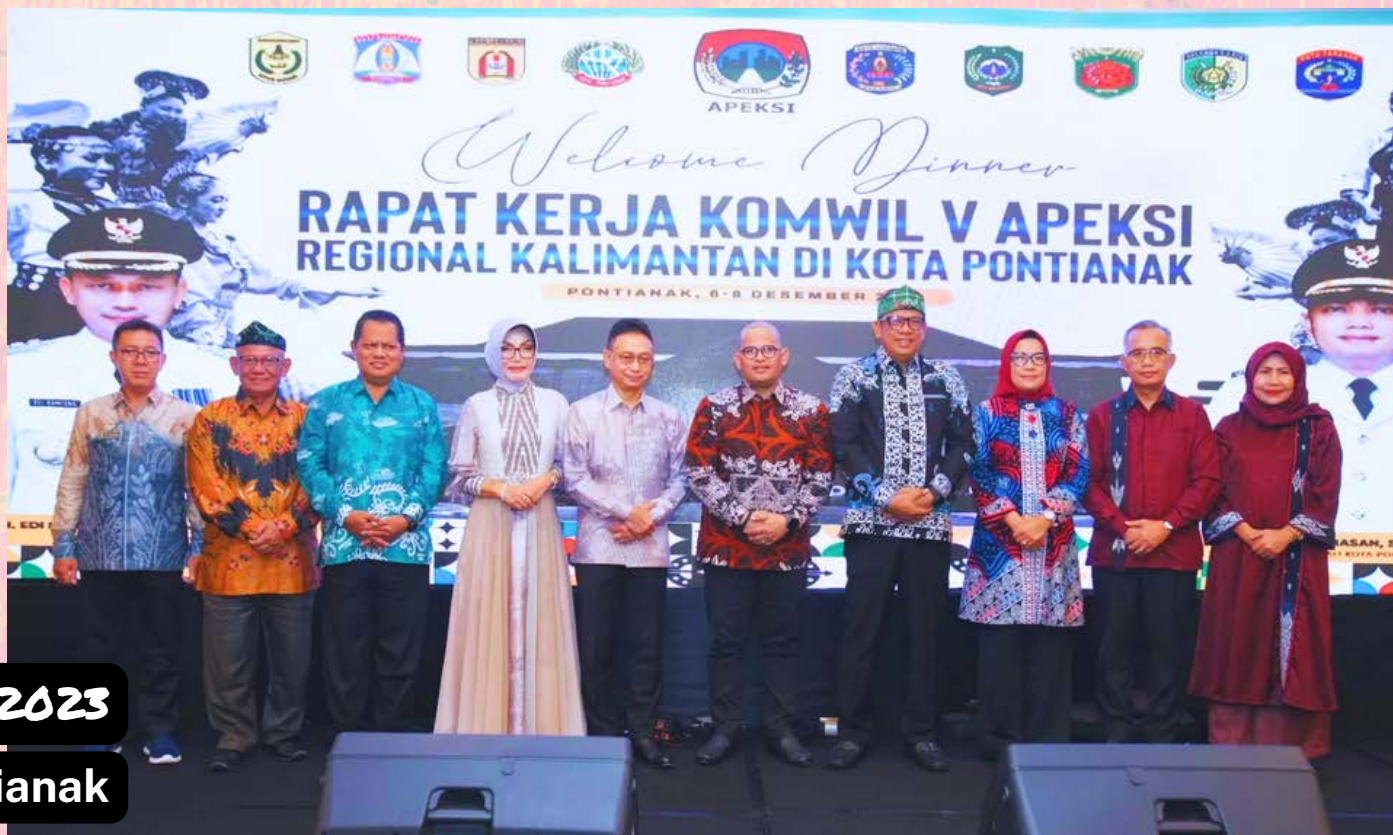
RAKERWIL V 2023