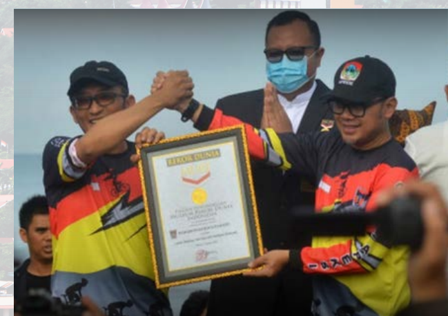
REKOR MURI MARANDANG + TEH TALVA