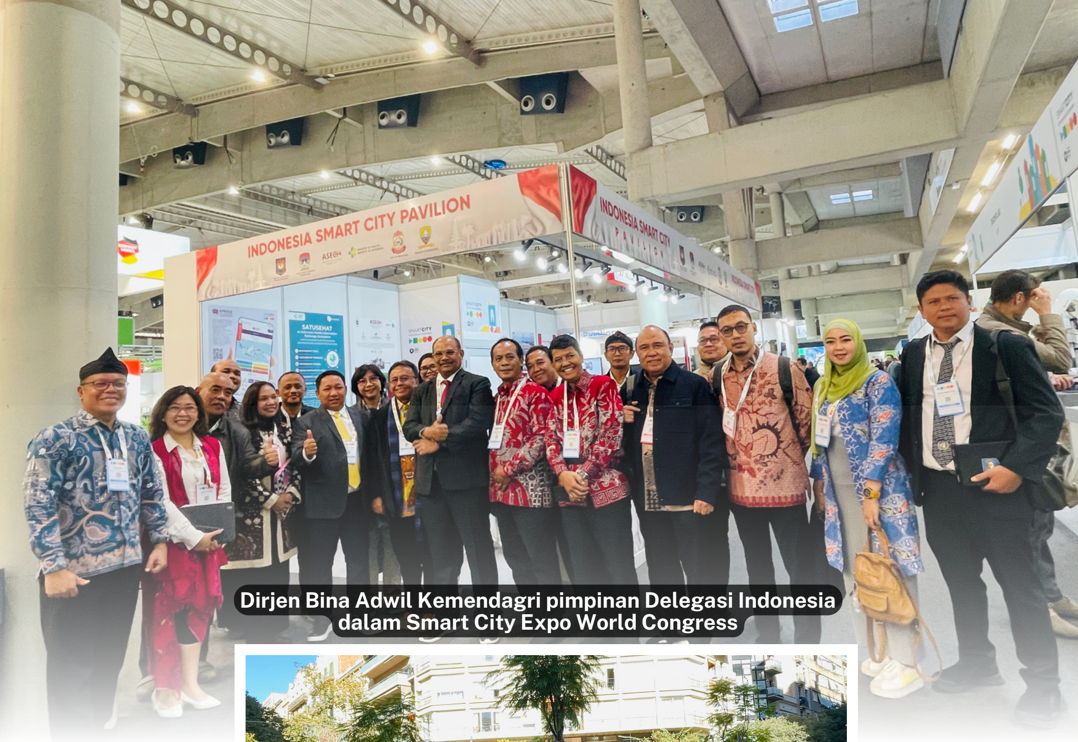
Dirjen Bina Adwil Kemendagri pimpinan Delegasi Indonesia dalam Smart City Expo World Congress