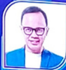
BIMA ARYA SUGIARTO Chairman of the Executive Board of the Indonesian City Government Association (Mayor of Bogor)