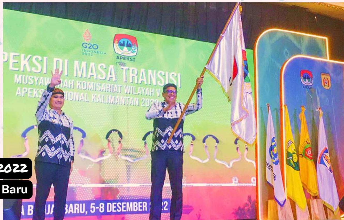
MUSKOMWIL V 2022