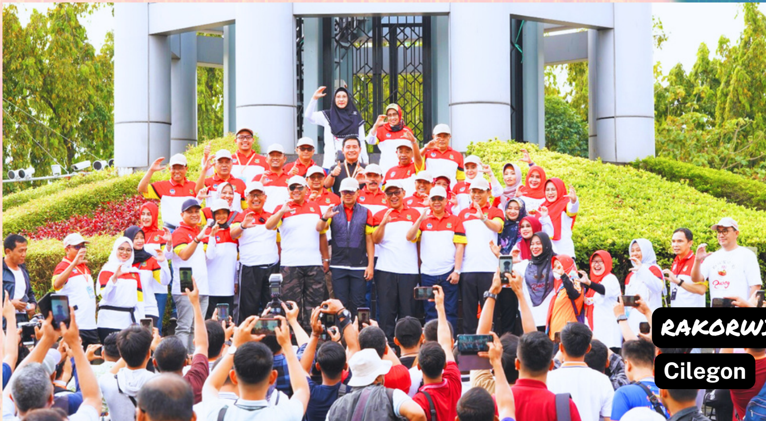
RAKORWIL III 2023