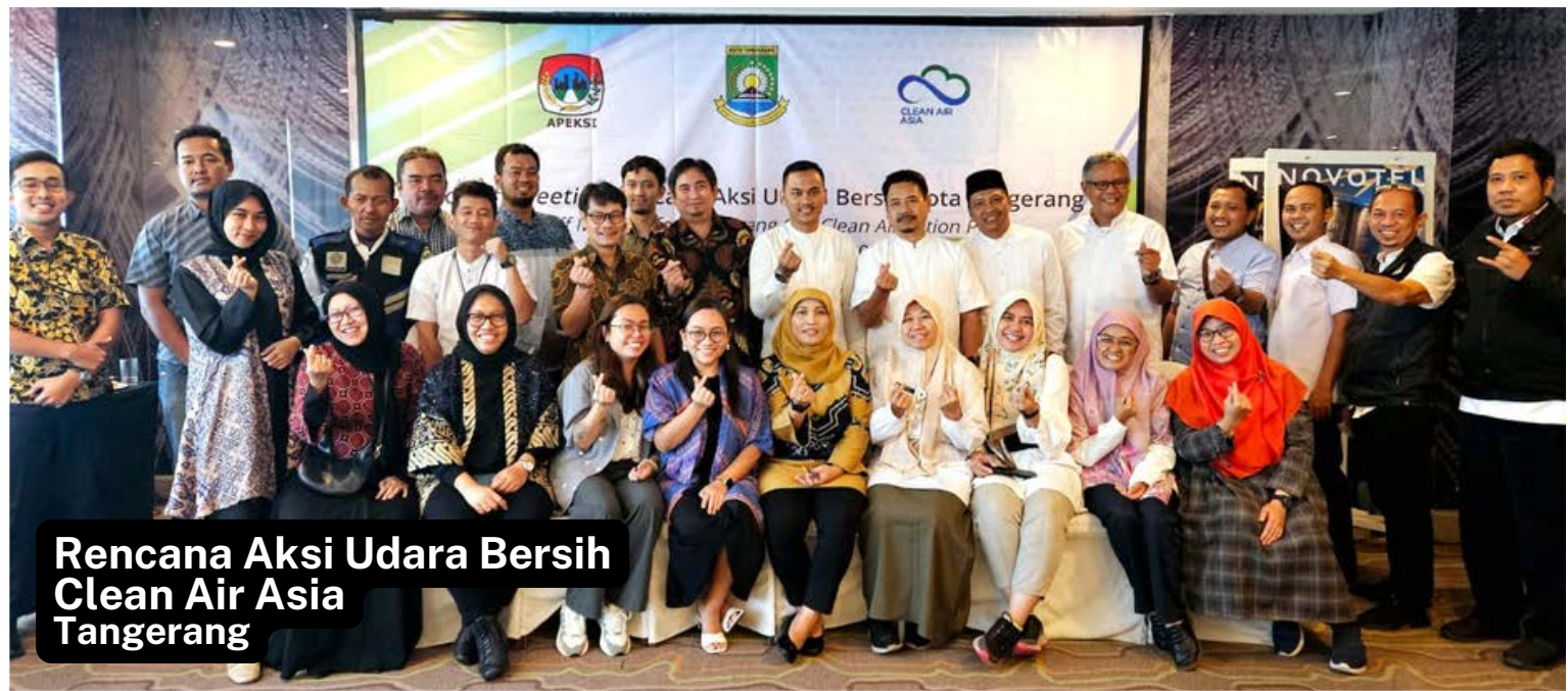
Rencana Aksi Udara Bersih Clean Air Asia Tangerang