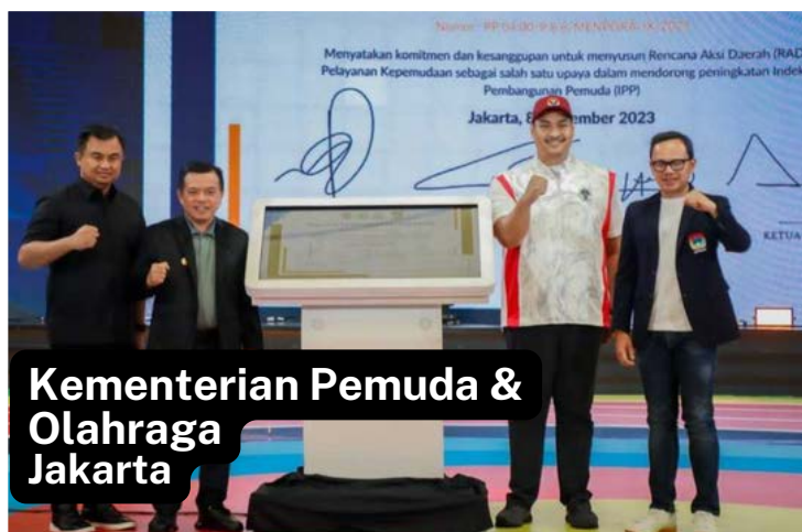
Kementerian Pemuda & Olahraga Jakarta