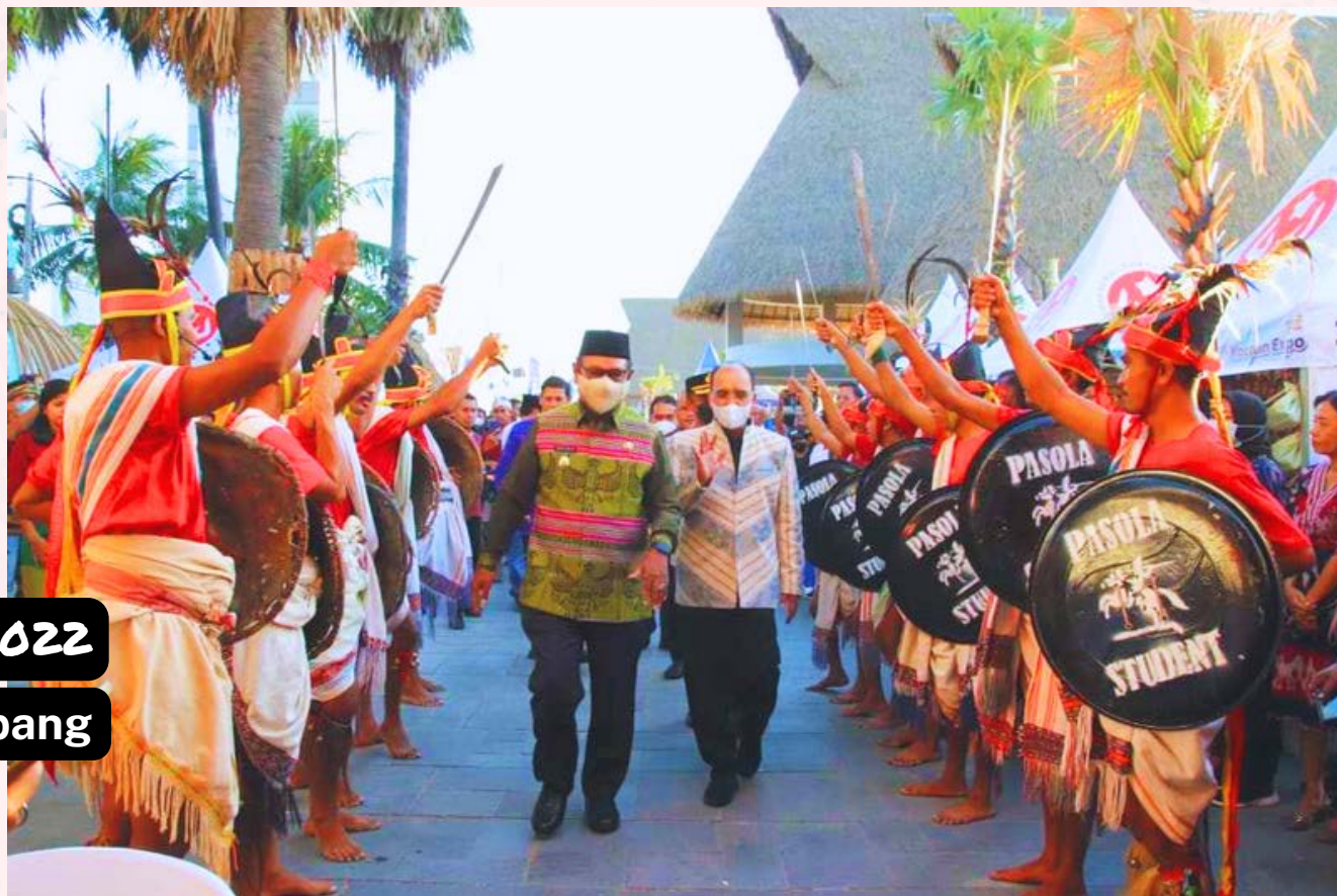
RAKERWIL IV 2022