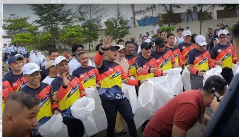
BERSIH-BERSIH PANTAI/ BEACH CLEAN UP