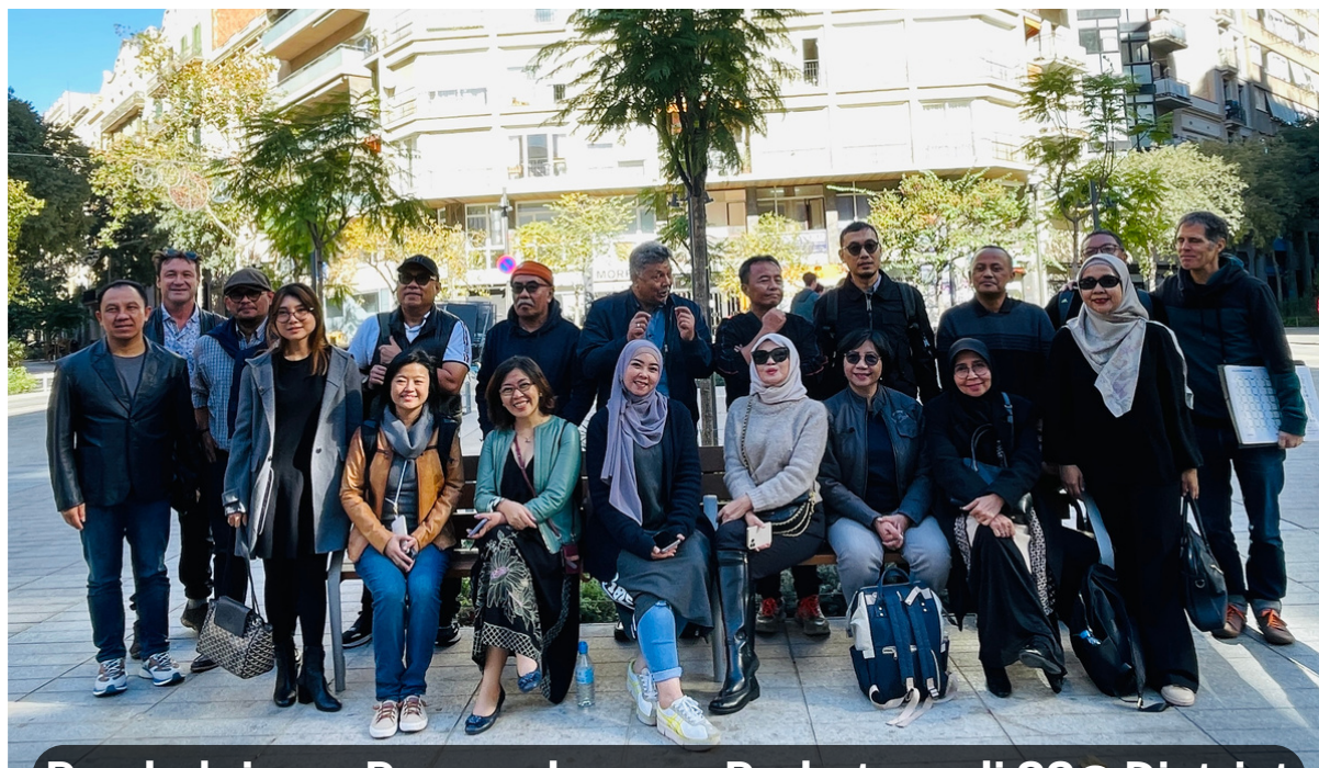
Pembelajaran Pengembangan Perkotaan di 22@ District Kota Barcelona, Spanyol