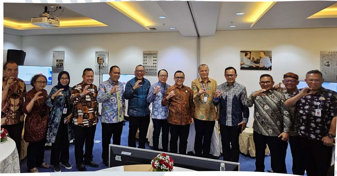
Bersama Menteri Pendayagunaan Aparatur Negara dan Reformasi Birokrasi - Jakarta