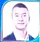
L'IE HENDO Director of Syntex Metrodata