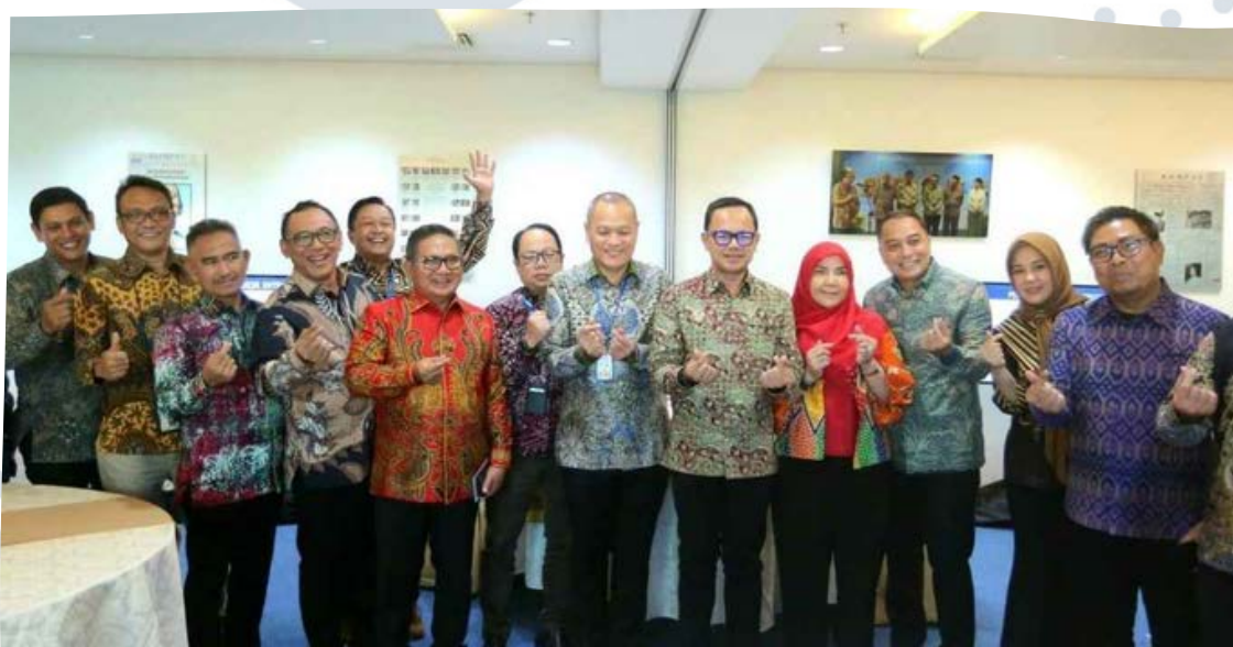
Bersama Menteri Koordinator Bidang Politik, Hukum, dan Keamanan - Jakarta