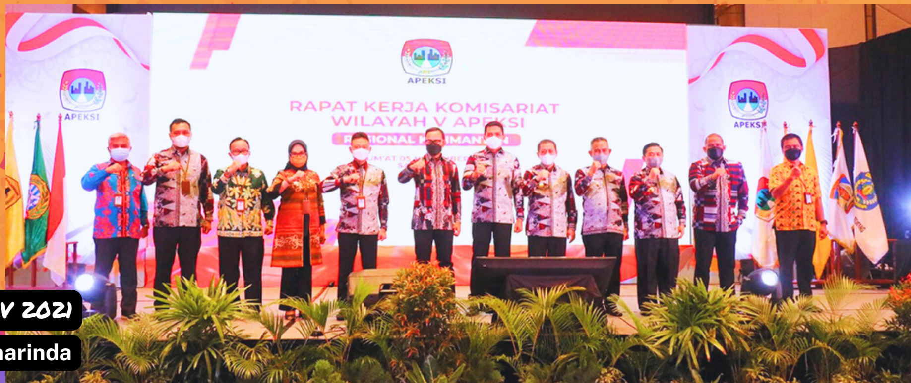
RAKERWIL V 2021