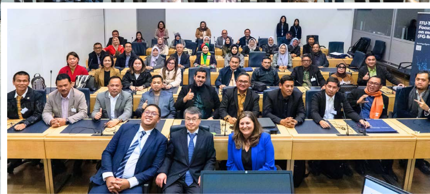
Jenewa, Switzerland & Paris