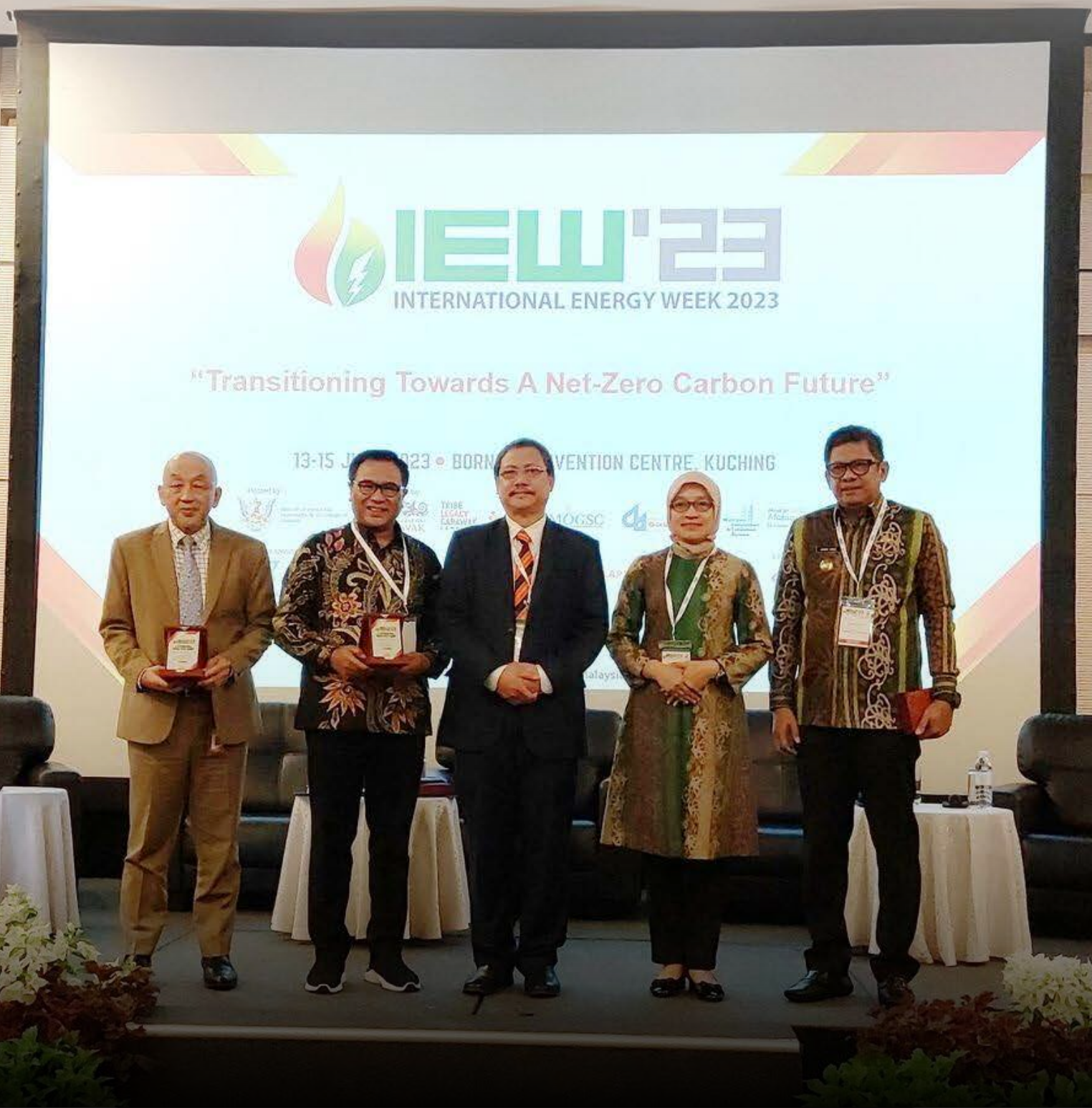
APEKSI sebagai host sesi Focus on Indonesia dalam International Energy Week 2023, bersama Sekretaris Daerah Provinsi Kalimantan Timur, Ketua Komwil V/Walikota Bontang & Wakil Walikota Malang Kuching, Malaysia