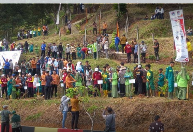
TANAM POHON DURIAN APEKSI