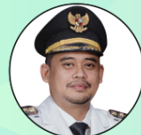
M. Bobby Affif Nasution, S.E., M.M. Ketua Komisariat Wilayah I/Walikota Medan