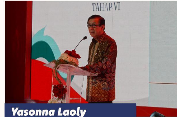
Yasonna Laoly Menteri Hukum dan HAM