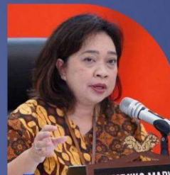
Hermin Esti Setyowati Deputi SDM Pariwisata & Ekonomi Kreatif