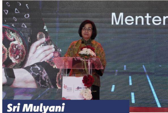
Sri Mulyani Menteri Keuangan Indonesia