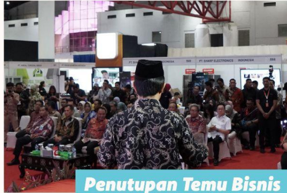
Penutupan Temu Bisnis Tahap VI