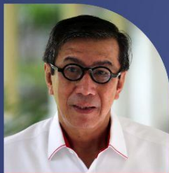
Yasonna Laoly Menteri Hukum dan HAM