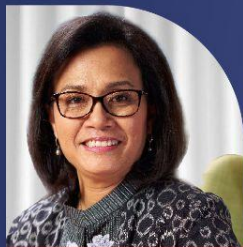
Sri Mulyani Menteri Keuangan