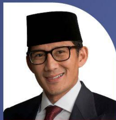
Sandiaga Uno Menteri Pariwisata & Ekonomi Kreatif